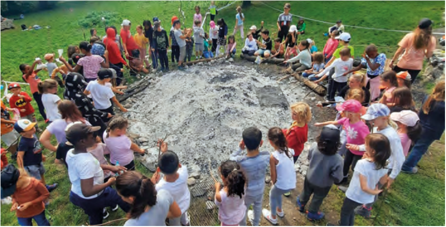
Torée des élèves du collège de Vauvilliers, octobre 2025

Les activités hors-cadre en faveur des écoliers sont en grande partie financées par les fonds de la CAE de Boudry. À l'approche de la Fête de la Jeunesse, portrait de ce maillon essentiel de la vie scolaire.