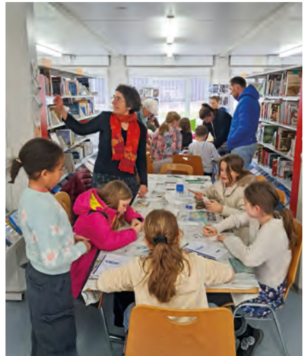
Animations le dimanche 29 mars 2026

Restez aux aguets: le prochain rendez-vous risque de détoner!