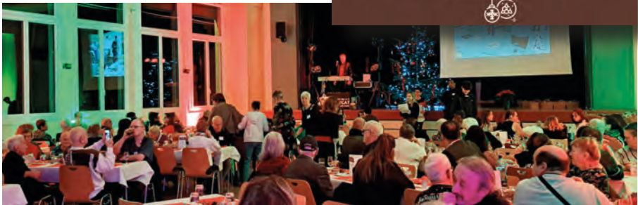
24 décembre 2025 à la salle de spectacles, animation musicale Pussycat Boudry.