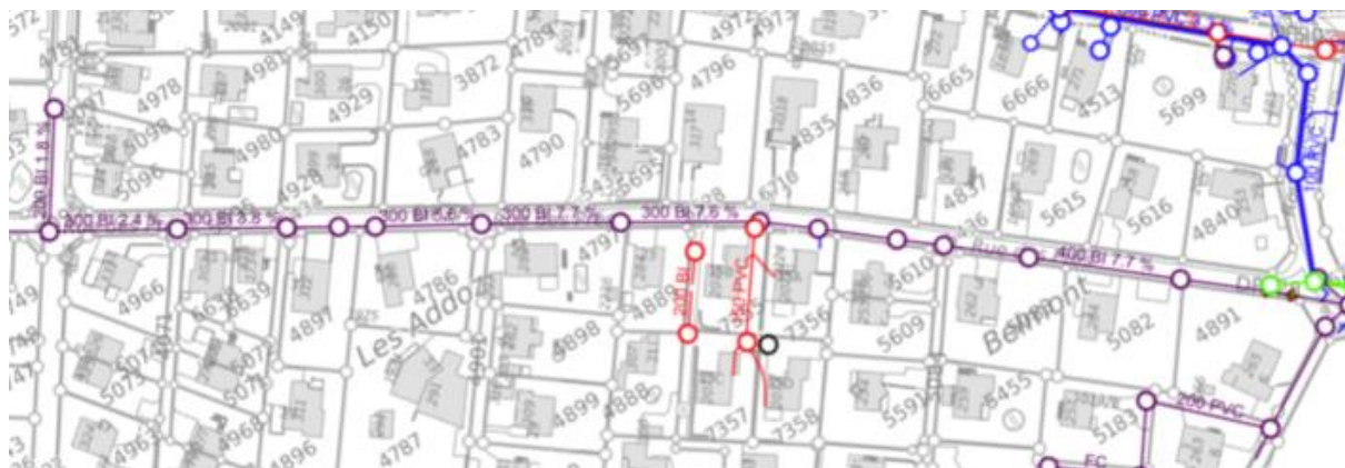
Plan du projet de réfection EU/EC

Pour la mise en séparatif, la construction d'un collecteur d'eaux claires sur le domaine public permettra de reprendre les dépotoirs nécessaires à la récolte des eaux de chaussée. Conformément au PGEE, les propriétaires devront se mettre en séparatif, en priorité par infiltration des eaux de pluie sur leur terrain dans les 5 ans. La subvention communale pour ces mises en séparatif sur le domaine privé est incluse dans le devis.