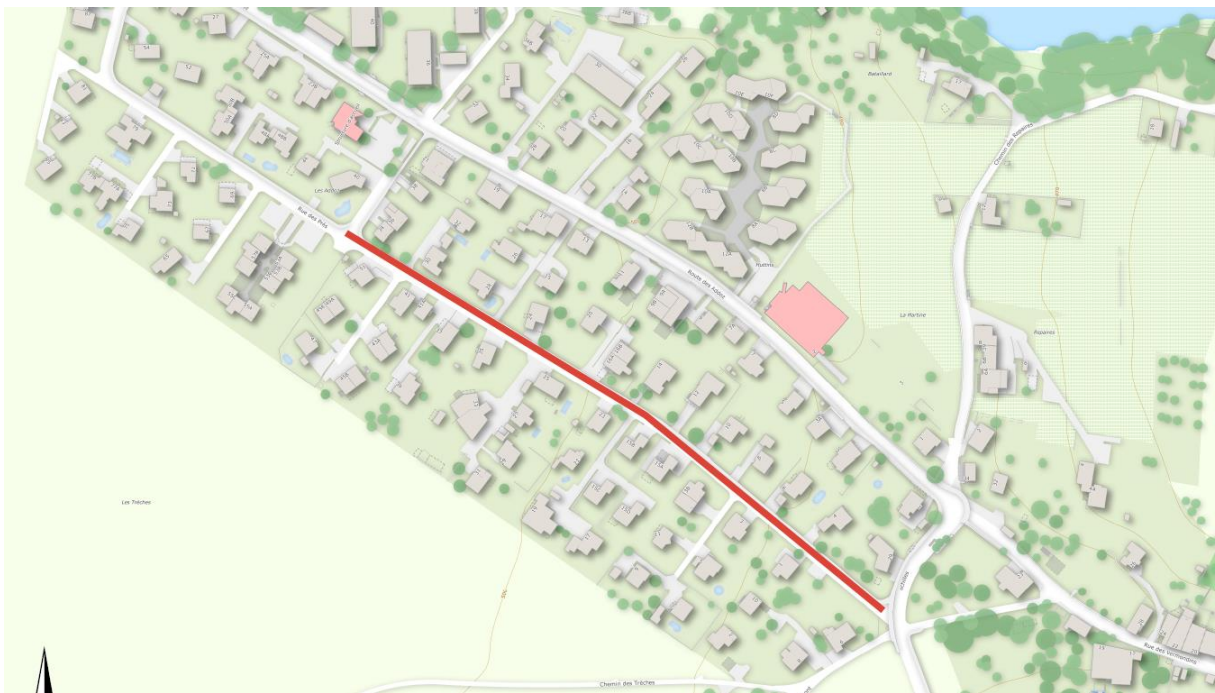
Illustration de la zone concernée par les travaux 2024

Il a été décidé de séparer ce grand chantier en 2 étapes. Le présent rapport concerne la première étape, l'investissement pour la partie supérieure ayant été planifié en 2025.