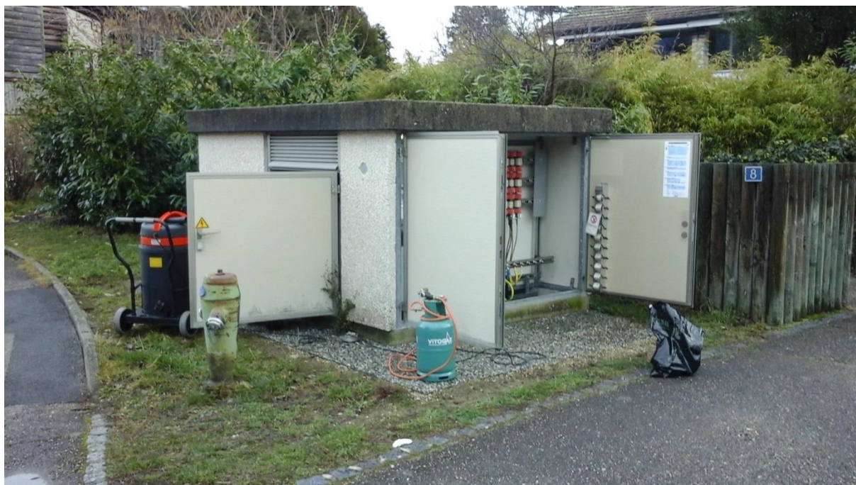
Figure 5 : Vue extérieur de la station « Pinceleuses »