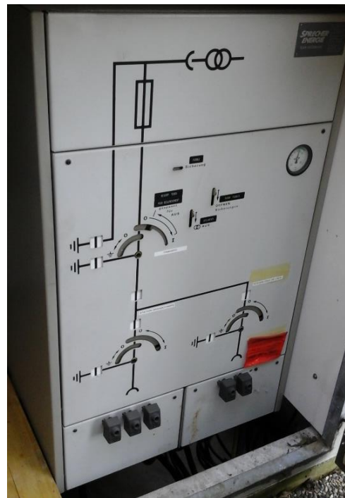
Figure 4 : Appareillage moyenne tension « Pinceleuses »