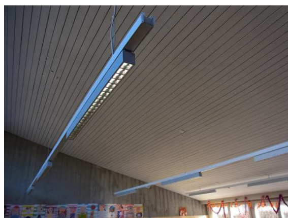
Nouveaux luminaires LED avec déflecteur pour le tableau noir et normal pour la classe