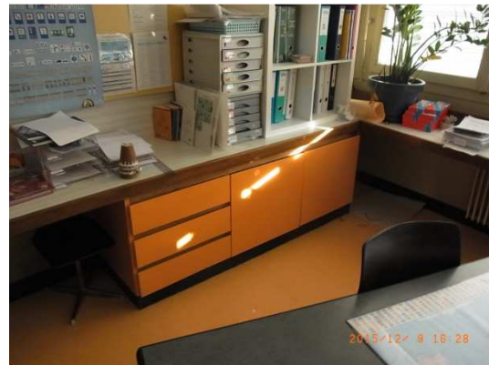
Meuble avant et après rénovation