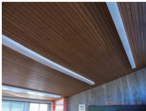
Anciens luminaires avec tubes fluorescents T8 et ballast ferromagnétique