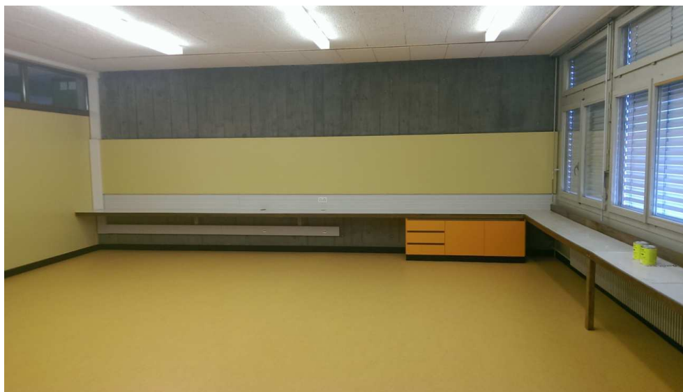
Vues d'une classe rénovée