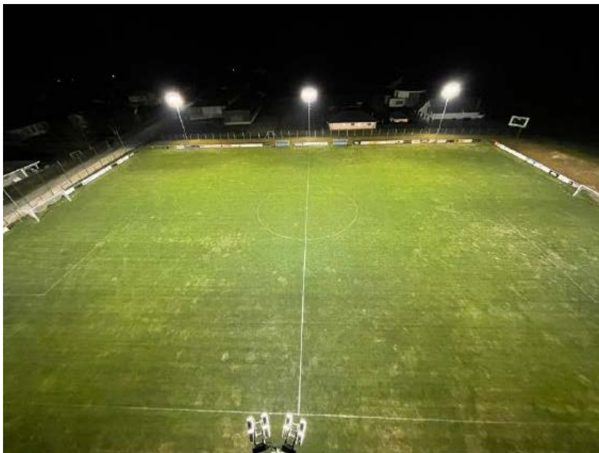
Exemple de terrain éclairé à l'aide des luminaires LED