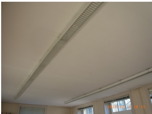
Anciens luminaires Tubes fluorescents T7

Ceci est confirmé par une étude menée en 2015 dans deux classes du collège de Vauvilliers où les luminaires datant du début du collège ont été remplacés par des luminaires LED. Le confort visuel est grandement accru ainsi que la répartition du flux lumineux qui est très homogène et donc beaucoup plus reposant pour les élèves et les enseignants.