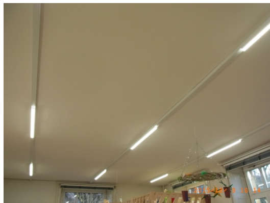
Nouveaux luminaires LED