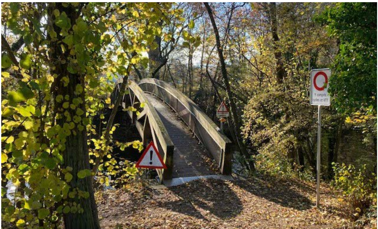
Figure 2 : la passerelle

Le tablier en bois de la passerelle est altéré par la pourriture en plusieurs endroits et est extrêmement glissant en cas de pluie. La charpente devrait également être mieux protégée contre les intempéries.