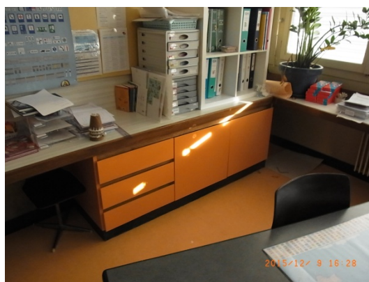
Meuble avant et après rénovation