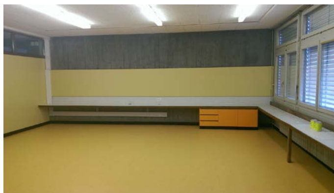
Vues d'une classe rénovée